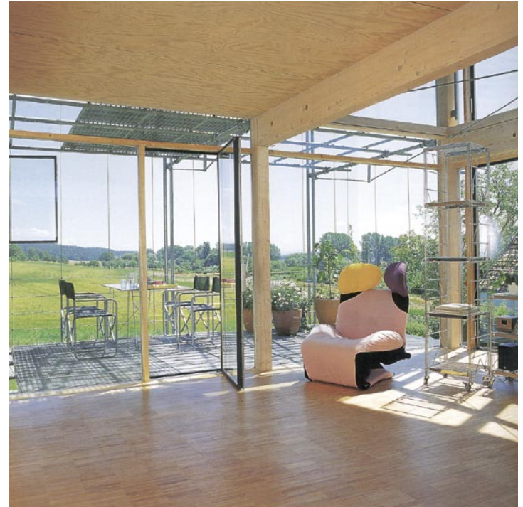
Figuur 31.1b Uitzicht vanuit een houten huis.

Nieuwe dorpen sluiten aan bij het vernieuwde denken over landschap en water. Het gaat dan om overloopgebieden, drinkwaterreservoirs, de Ecologische Hoofdstructuur, waardevolle cultuurlandschappen, landschapsverwildering, toenemende recreatie, stiltegebieden, nieuwe bossen. Het is slechts een greep. Nieuwe dorpen kunnen die invalshoeken meenemen. Denk aan drijvende woningen of woningen op palen in overloopgebieden voor mensen die aan het water willen wonen.