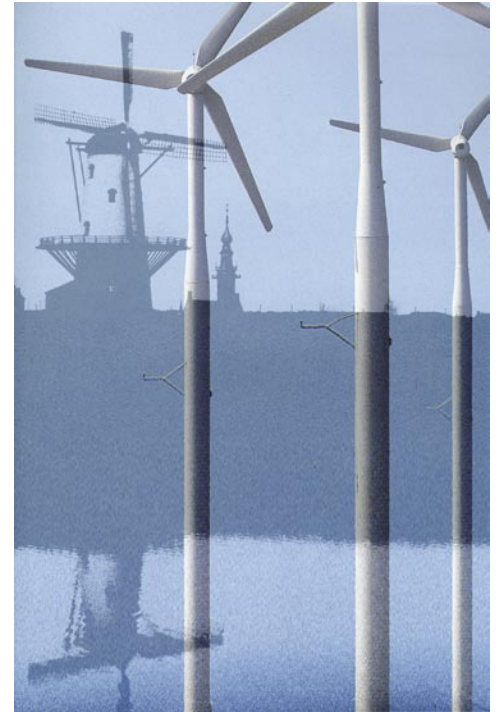
Figuur 31.3 Windmolens.

menselijke cultuur, natuur en water door de bestaande situatie als basis voor nieuwe ideeën te beschouwen.