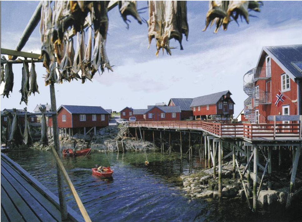
Figuur 31.2 Lofoten: rode woningen.