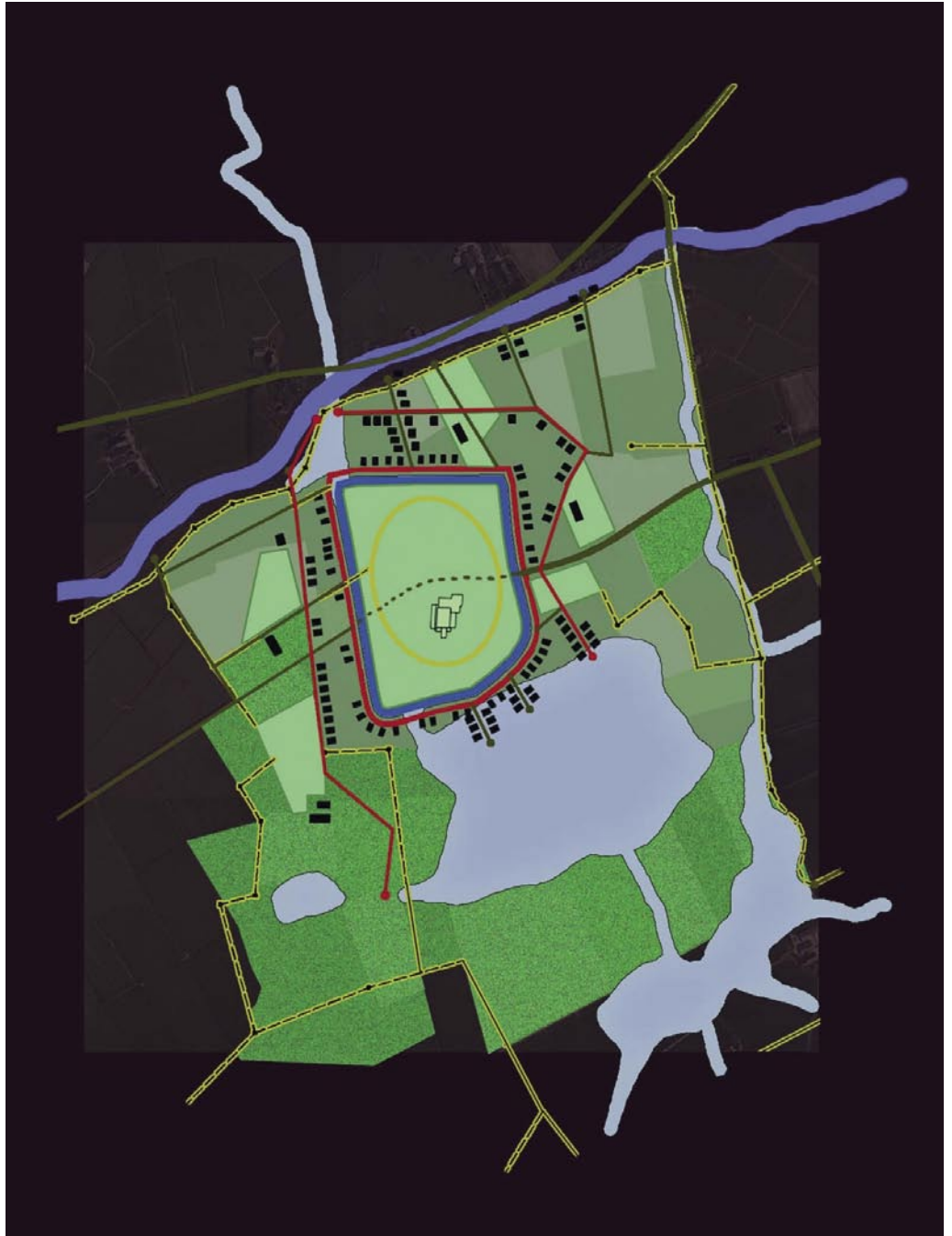
Figuur 31.5a Luchtfoto Plan Dantumad.

In het ontwerp voor Nieuw Klaarkamp wordt het centrum een centraal park op de plek van het klooster. Daardoor worden de archeologisch interessante resten van het klooster beschermd. Rond het park komen woningen. Voor jongeren komen er kleine betaalbare huizen. Maar er komen ook grote kop-hals-rompachtige woningen, waar wonen en werken gecombineerd kunnen worden. En er komt een 'stins' (woontoren) als nieuw herkenningspunt in het landschap. Dit was vroeger een toevluchts-