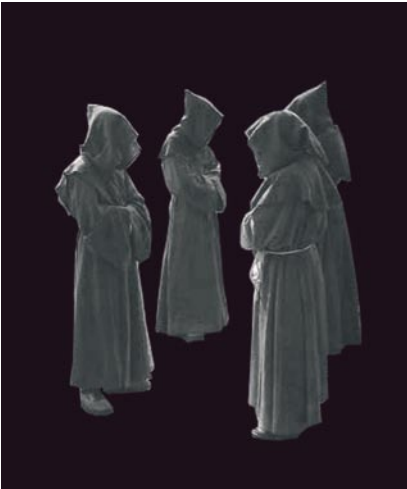
Figuur 31.4 Schiere monniken.