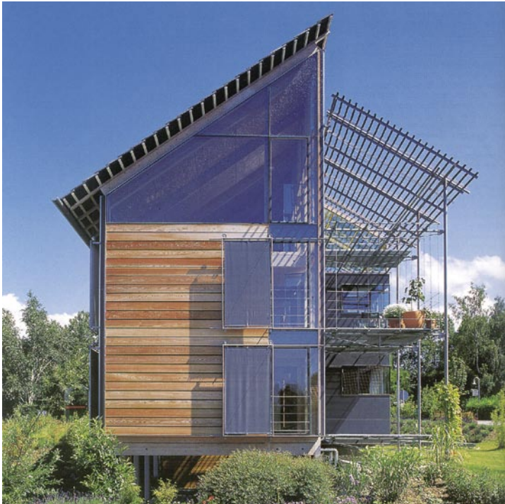
Figuur 31.1a De buitenkant van een houten huis.

Veel mensen willen mooi wonen in een groene omgeving. In nieuwbouwwijken vormt de grootste gemene deler het uitgangspunt voor woningbouw. Dit resulteert in een eenvormigheid die geen recht doet aan individuele wensen van bewoners. In nieuwe dorpen kunnen mooie woonomgevingen ontstaan die meer zijn toegespitst op specifieke wensen, zoals een werkplek aan huis, een geitje in de tuin, wonen in het bos, wonen aan of op het water. Dus wonen op kleine schaal met een mooi centrum en een omgeving die het waard is om gekoesterd te worden door bewoners.